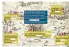
de Niet-Gebied kaart